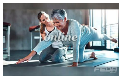
Pilates Mat y Lesiones