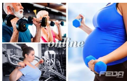
Fitness 2: Patologías y Poblaciones especiales