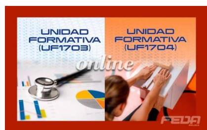
Valoración de las Capacidades Físicas

Contacta con nosotros en el 644 410 226 para informarte sobre nuestros cursos online