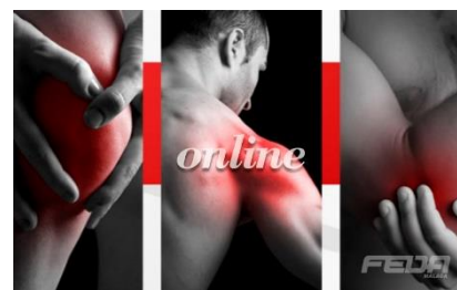
Fitness 2: Readaptación de Lesiones Deportivas