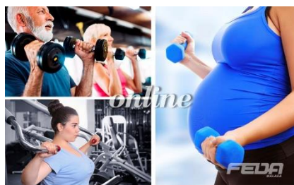
Fitness 2: Patologías y Poblaciones especiales