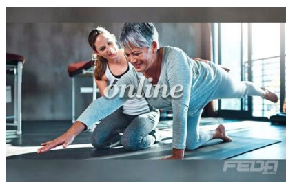
Pilates Mat y Lesiones