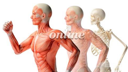
Fundamentos de la Motricidad Humana