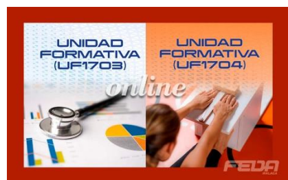
Valoración de las Capacidades Físicas

Contacta con nosotros en el 644 410 226 para informarte sobre nuestros cursos online