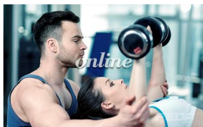
Sala Fitness y Entrenamiento Personal: nivel 1