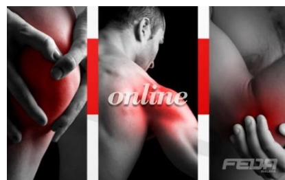
Fitness 2: Readaptación de Lesiones Deportivas